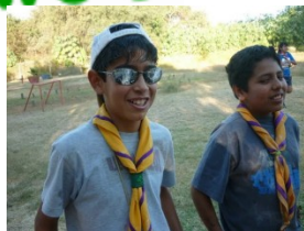
XXI Aniversario de Gpo Hoja 3