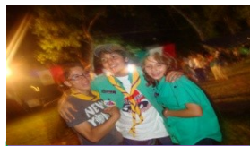
Noche Mexicana Gpo 2 Hoja 2