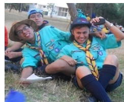
Visita al Grupo II