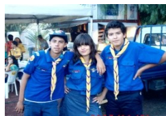
La comunidad de caminantes